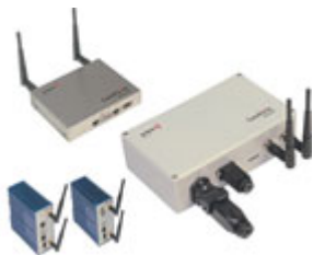
Рисунок 1. Точки доступа продуктовой линейки Artem Compoint Industrial: в корпусе из специальной стали стандарта IP40 (сверху), в корпусе для использования вне помещений стандарта IP65 и в корпусе для установки на монтажную шину (внизу слева).

Для агрессивных сред предлагаются точки доступа в корпусах из специальной стали IP40 (см. Рисунок 1). При встраивании в распределительные шкафы (спецификация корпуса IP20) они устанавливаются непосредственно на монтажные шины. Разъемы антенн выводятся из шкафа, и в них устанавливаются соответствующие внешние антенны. При помощи подогреваемого, защищенного от рабочей воды корпуса (IP65) возможна работа в так называемых средах глубокой заморозки — в морозильных камерах. Само собой, такие устройства пригодны и для использования вне помещений при низкой температуре и высокой влажности.